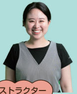
サポートインストラクター