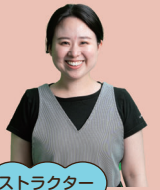
サポートインストラクター